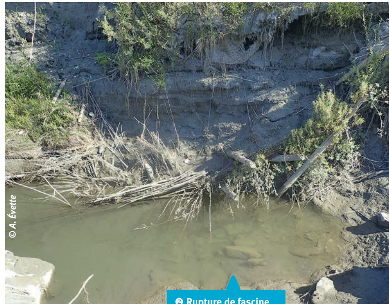
2 Rupture de fascine en pied de berge.

Les nouvelles valeurs établies pour les ouvrages de plus de quatre ans peuvent paraître faibles par rapport aux