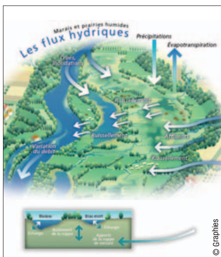
Le continuum aquatique intègre différentes dimensions.